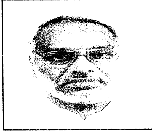
राजेन्द्र महतो राष्ट्रीय अध्यक्ष